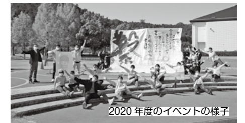
2020年度のイベントの様子

「彦根市シティプロモーション戦略」に沿って、市民が自発的に楽しみながら取り組めるシティプロモーション活動を、市と協働して進めています。