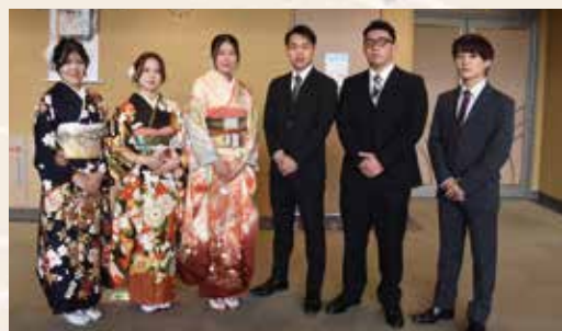
▲実行委員会の皆さん

1月11日に二十歳のつどいがひこね市文化プラザで開催されました。今年のテーマは「 げんどうりょく 彦動力～1192人の歩み～」。 今年度二十歳を迎える825人が参加し、旧友との再会を喜ぶ笑顔があふれる、晴れやかな一日となりました。