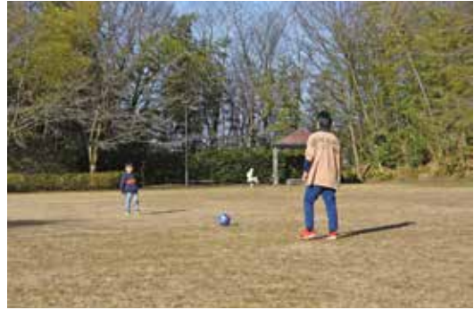
▲ボール遊びを楽しむ親子