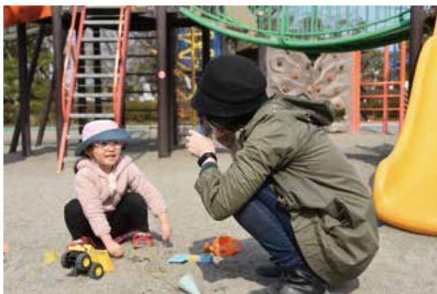
▲「アイスクリーム屋さんごっこ」をして遊ぶ親子