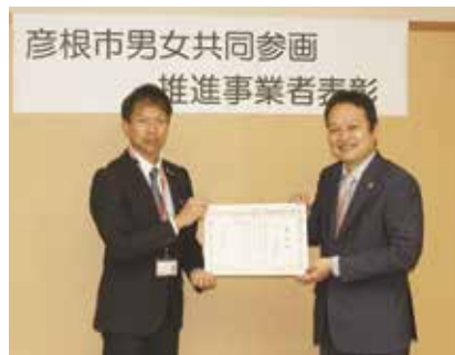
▲リコージャパン(株)彦根事業所代表者(左)