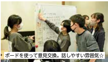
ボードを使って意見交換。話しやすい雰囲気☆

グループごとの話し合いでは、タブレットや電子黒板などを活用したり、発表の際は発言しやすい雰囲気づくりのため教室のレイアウトを変えたりしていました。児童の皆さんは、意見や質問などを積極的にやりとりし、とても盛り上がった様子でした。