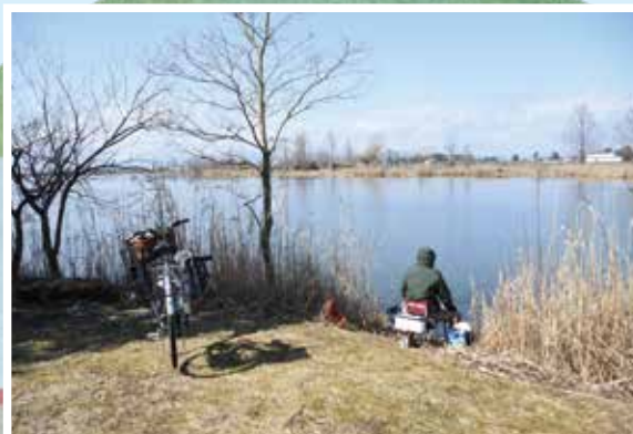
▲天気の良い日には釣り人もちらほら