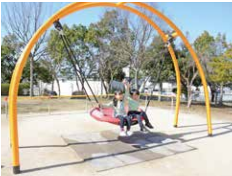
▲障害のある人もない人もみんなが楽しめる遊具