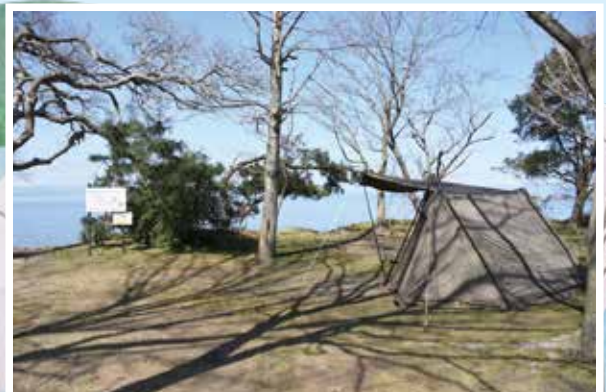
▲琵琶湖の景色をゆったりと眺めながらキャンプができる