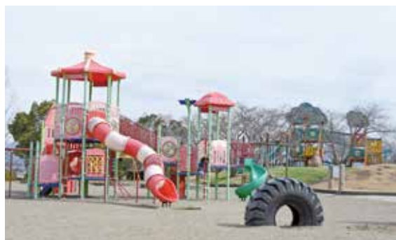
▲たくさんの遊具がある「子どもの里」

音楽パフォーマンスやフェス、マルシェなどが開催されることもあり、市民の憩いの場となっています。