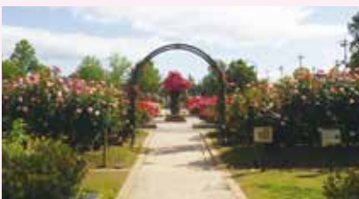
▲5月に見頃を迎えるバラ園

砂場遊びができたり、遊具があって、子どもをゆっくり遊ばせられるところです。庄堺公園は季節の花が咲くところも魅力的です。バラの季節になると、子どもと一緒にバラ園（左写真）の前で写真を撮ったりしています。きれいな花を見て、子どもたちも喜んでます。