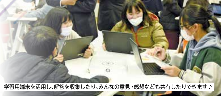
学習用端末を活用し、解答を収集したり、みんなの意見・感想なども共有したりできます！

アクティブラーニングとは、児童生徒が積極的・能動的に学習・参加できる授業形式のことです。