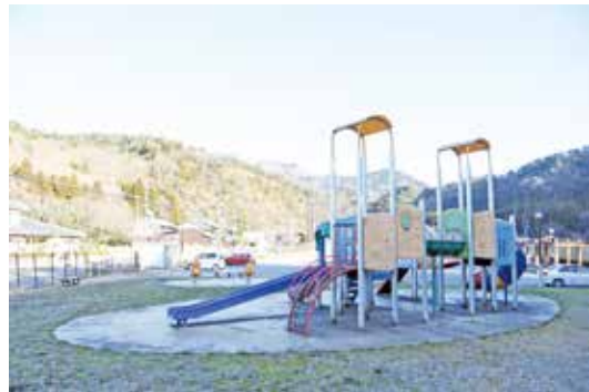
▲遊具エリア(写真)と芝生の多目的広場がある