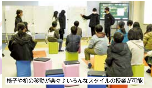
椅子や机の移動が楽々！いろんなスタイルの授業が可能

今年度、市内小・中学校のパソコン機器のリースの入れ替えに伴い、これまでのコンピュータ教室を見直し、市内 4 小学校と 7 中学校に本格的なアクティブラーニング教室を整備しました！（残る 13 小学校については令和 6 年度に整備予定）2 月 22 日には、若葉小学校で公開授業が行われ（写真のとおり）、