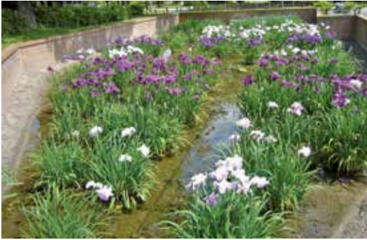
▲5月はバラ、6月はしょうぶ(写真)が楽しめる