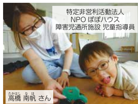
特定非営利活動法人 NPO ぽぽハウス 障害児通所施設 児童指導員

私の仕事は、子どもが持つ可能性に目を向け、得意なことを伸ばして「一歩ずつの成長」を近くでサポートすることです。毎日同じように過ごしているようで、泣いたり笑ったり様々な表情を見せてくれる子どもたちが大好きです。子どもたちのペースを大切に、自分らしく穏やかに過ごしてほしいと願っています。その中で、子どもたちと一緒に私自身も成長していけるように頑張っていきたいと思っています。