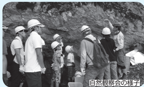
自然観察会の様子

圏域内で発生するごみと環境負荷を減らすため、生ごみの堆肥化や古紙等資源回収の補助を行っています。