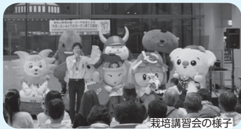
栽培講習会の様子

ゴーヤの栽培方法を学ぶ講習会や、優秀作品を表彰・紹介する緑のカーテンコンテストなど、多くの人に取り組んでいただけるよう努めています。