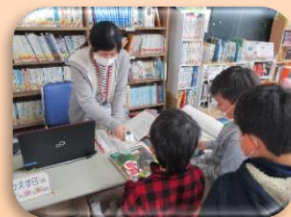
【図書室の環境整備】