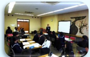
【中学生交流会の様子】