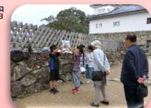
【彦根城ボランティアガイド】