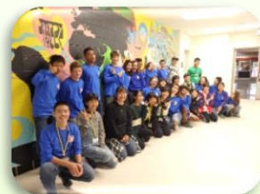
【中学生のアナーバー市への派遣】