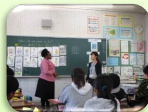
【小学校英語の授業場面】