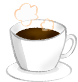
ホットコーヒー (1カッブ100円)