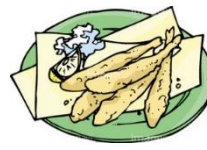
ワカサギ天ぷら(1カッブ300円)