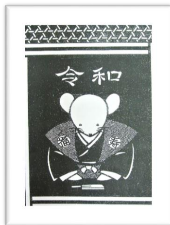
※講座で作成します。