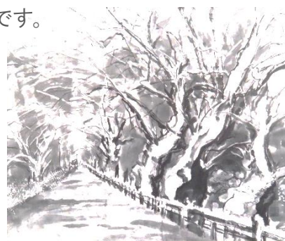
現水展 出展作品 「芹川けやき道」