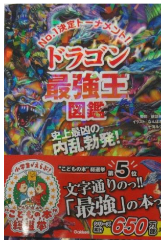
“こどもの本” 総選挙 第5位 ドラゴン最強王図鑑 監修：健部伸明