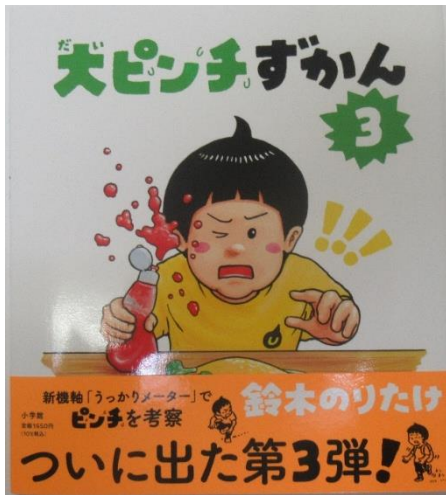
“こどもの本” 総選挙 第1位 大ピンチずかん3 作：鈴木のりたけ