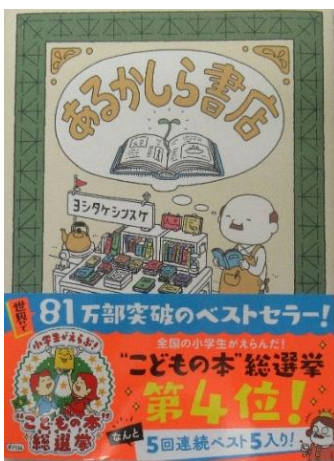
“こどもの本” 総選挙 第4位 あるかしら書店 著者：ヨシタケシンスケ