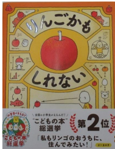
“こどもの本” 総選挙 第2位 りんごかも しれない 作：ヨシタケシンスケ