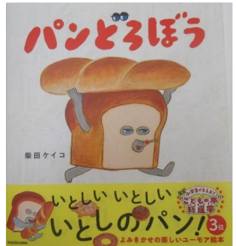
“こどもの本” 総選挙 第3位 パンどろぼう 作：柴田ケイコ