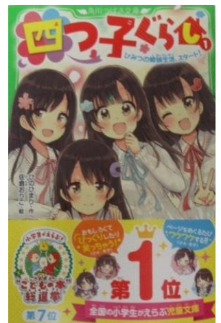
“こどもの本” 総選挙 第7位 四つ子ぐらし① 作：ひのひまり