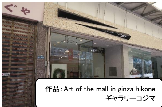
作品:Art of the mall in ginza hikone ギャラリーコジマ

駅前お城通り沿いの旭町にある飲食店のサインです。シンプルなロゴマークと波模様が入ったのれんから、お店の雰囲気が醸し出されています。