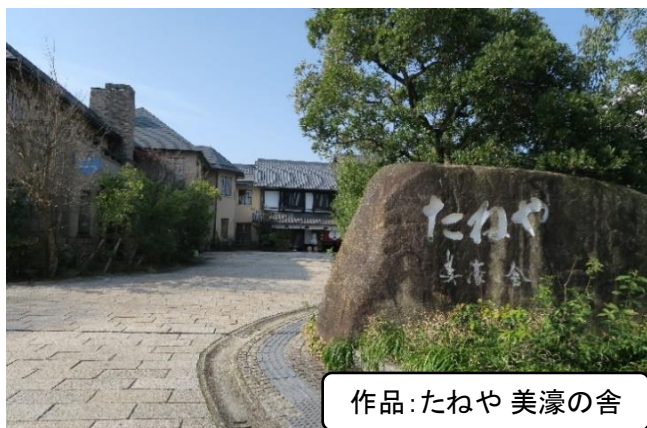
作品:たねや 美濠の舎