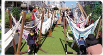
岐阜市金華橋大通り