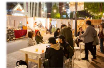
姫路市大手前通り