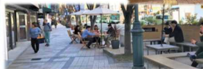
神戸市三宮中央通り