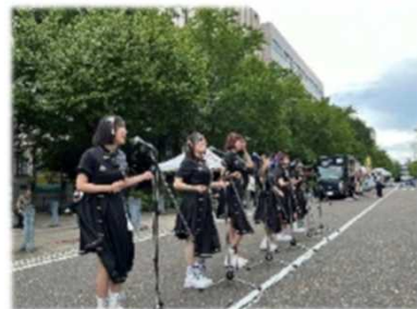
横浜市マグカル解放区