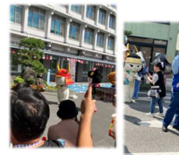
駅前お城通り （国民スポーツ大会開会式）