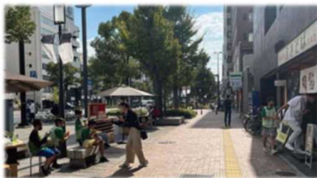
姫路市大手前通り