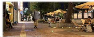
姫路市大手前通り