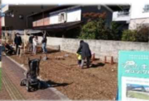
大町市中心市街地