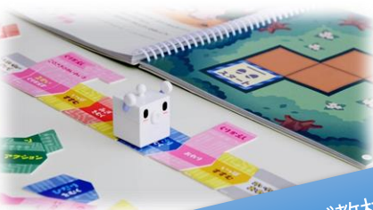
プログラミング教材