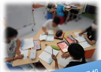
自由に組み替えられる机