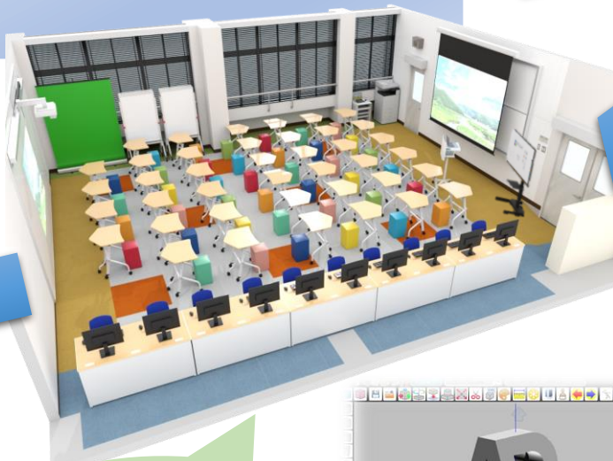
プロジェクター・配信設備