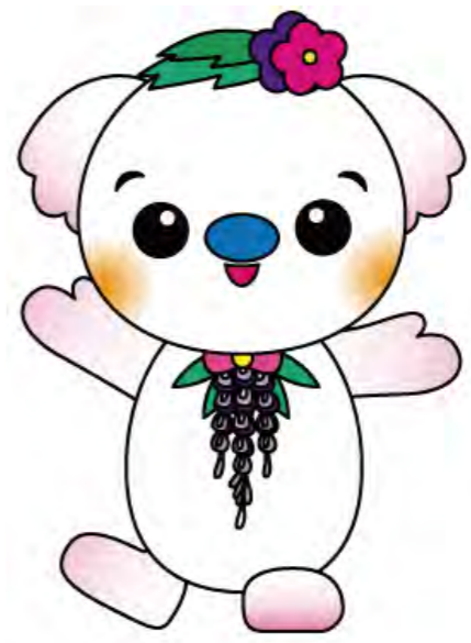
甲良町のキャラクター ココラちゃん