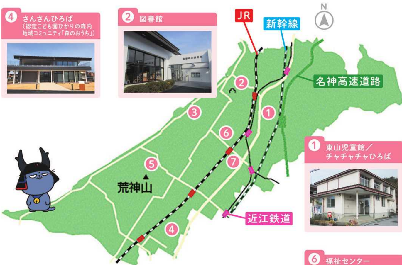
1 東山児童館/ チャチャチャひろば