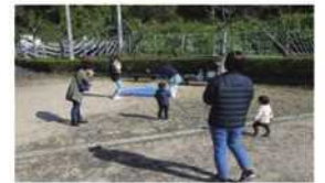
東山児童館ひろば

※夏休み期間中、学びや体験を通して、小学生の親子や参加者相互のふれあいを深めるため、夏休み親子ひろばを開催します。(木工、子ども電気出前教室など)