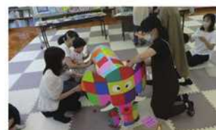
子育て講座「絵本で子育て」