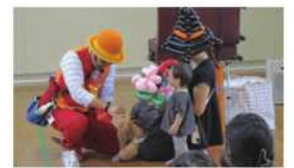
市民交流フェスタ(バルーンアート)