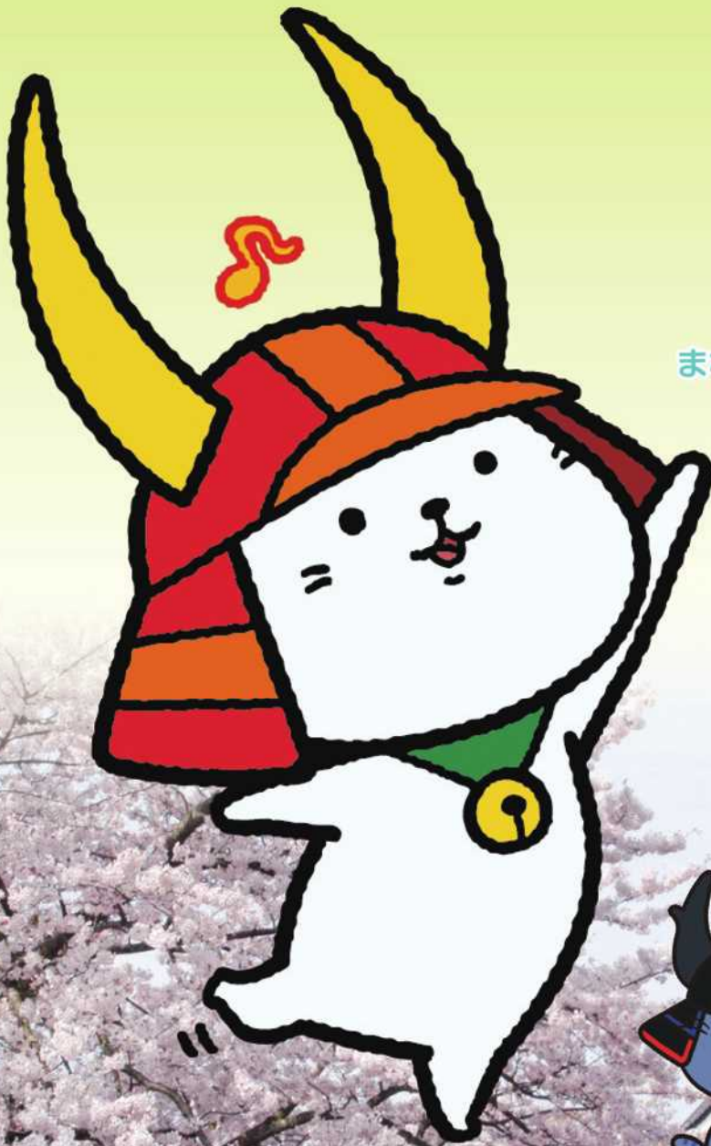
彦根市キャラクター 「ひこにゃん」