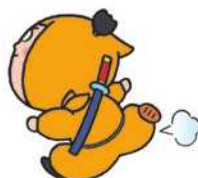
7 まんまるひろば (ビバシティ彦根内)