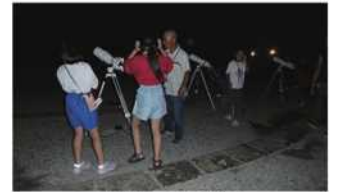
天文クラブの様子

アリーナでは、幼児から中学生を対象にボール・なわとびなどの遊具の貸出や持ち込みもでき、軽運動が楽しめます。また、ゲームや図書の貸出、部屋の貸館を行っています。