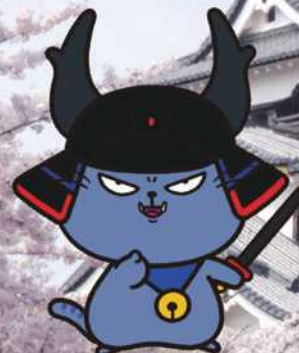
ひこにゃん公認ライバルキャラクター 「わるにゃんこ将軍」