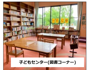
子どもセンター(図書コーナー)

プロシードアリーナHIKONEのまちなか交流ラウンジでも 自習ができるよ! (火曜日は休館です。詳しい開館日はホームページを確認してください。)