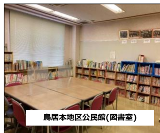
鳥居本地区公民館(図書室)