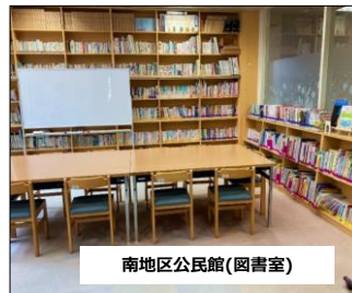
南地区公民館(図書室)