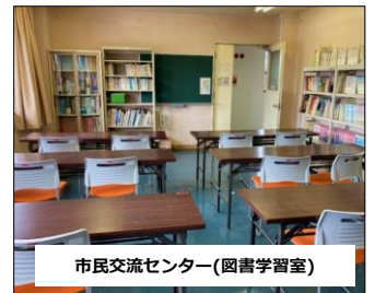
市民交流センター(図書学習室)