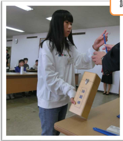
議席番号を決めるくじびき

子ども議会も実際の議会と同様に、子ども議員が質問し、市長等が答弁することとなるため、議場では、議場開放促進委員によるデモンストレーションで、子ども議会の進行や質問の仕方などについて学び、質問等の練習を行いました。