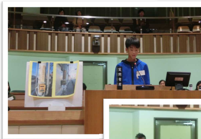
議場でのリハーサル