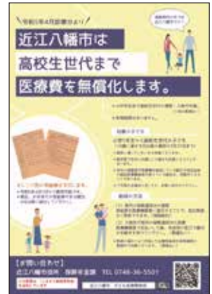
▲令和5年4月より18歳まで拡充された近江八幡市の医療費無償化