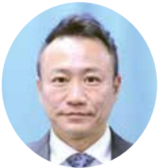
森野 克彦議員 福祉病院教育常任委員会