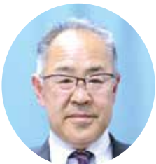
黒澤 茂樹議員 市民産業建設常任委員会