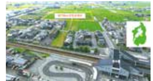
▲専門職大学建設予定地 (令和9年度開校予定)

A 映画や俳優のファンの方々が彦根を訪れるとともに、映画産業が集積することで、より本市の活性化につながり、専門職大学を設置されることにより、映画のまち彦根のブランド力向上の第一歩になる。