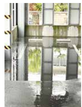
▲雨水により冠水し駐車できないスペース