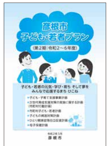
▲彦根市子ども・若者プラン