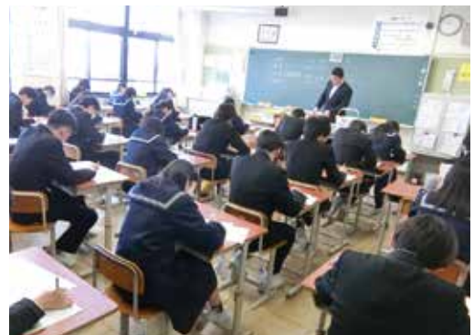
▲受検に向けての授業風景

A 今回の入学者選抜制度の改正で、生徒にとって大きな変更点は選抜時期の一本化と学力検査の全員受検と考える。現行の入学者選抜制度では、生徒が多様な選択肢から志望校を決定することができる一方、受検期間の長期化による負担の増加、特色選抜の受検倍率の高さから多数の生徒が不合格を経験すること、早期に入学許可予定者通知を受けた生徒の学習に対するモチベーションの維持の難しさ等が課題として挙げられる。