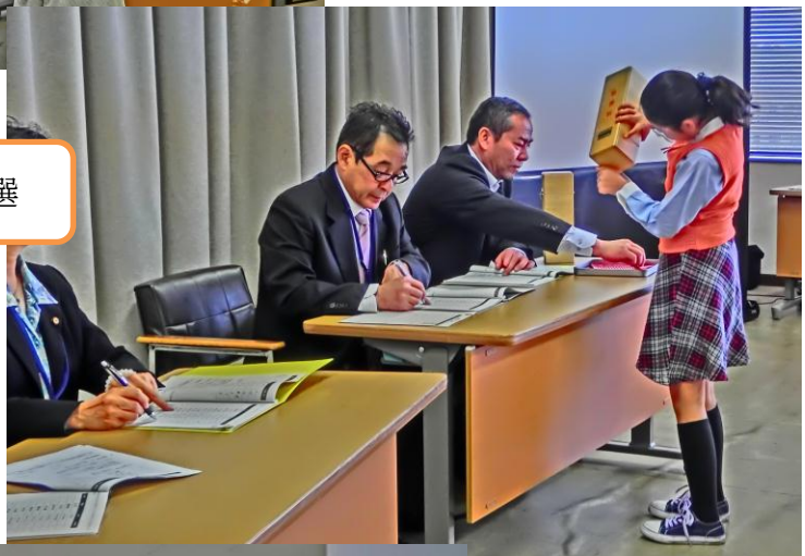
議席番号と発言順位の抽選