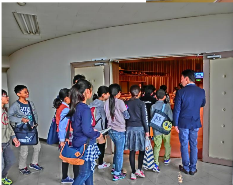
議場でのリハーサル