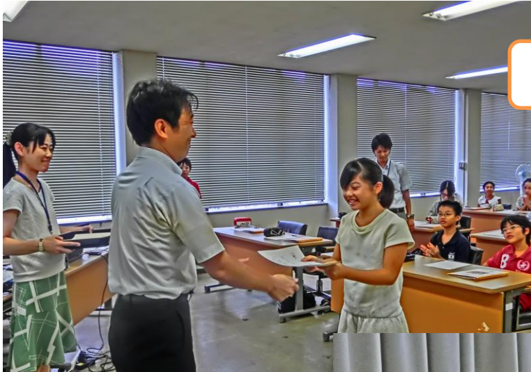
子ども議員選出書交付

子ども議員21人のなかから、3人の議長が抽選により選出された他、子ども議会での子ども議員の質問の順番を決めるための抽選が行われました。また、子ども議会の進行の仕方について学び、議場で質問等の練習を行いました。子ども議会の本番では、実際の議会と同様に子ども議員が質問し、市長等が答弁することとなるため、議会の進行ルールを本番と同様に体験し、本番に備えました。