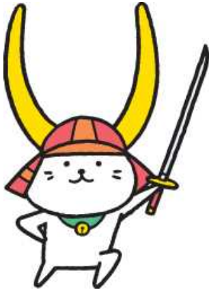
ひこねし 彦根市キャラクター

また、きゅう はな あ ひつよう しょう ひら ぎかい りんじかい また、急に話し合いをする必要が生じたときに開く議会を「臨時会」といいます。