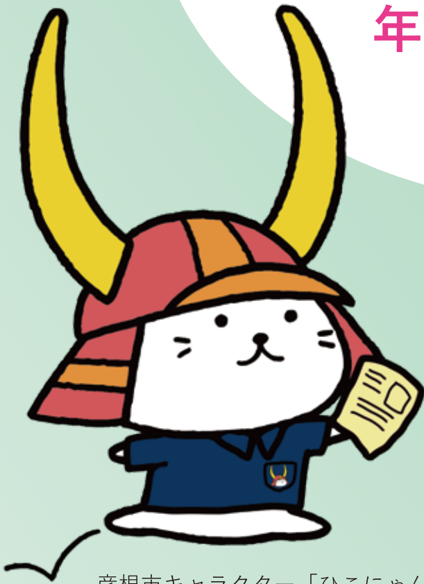
彦根市キャラクター「ひこにゃん」