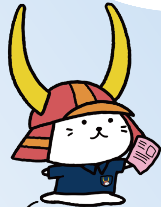
彦根市キャラクター「ひこにゃん」