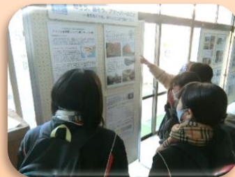
【北米研修派遣事業パネル展】