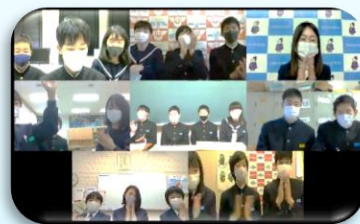
【虹のかけ橋プロジェクト】