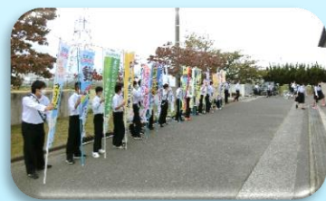
【あいさつ運動の様子】