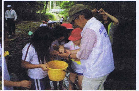
捕獲した生物の分類 ①