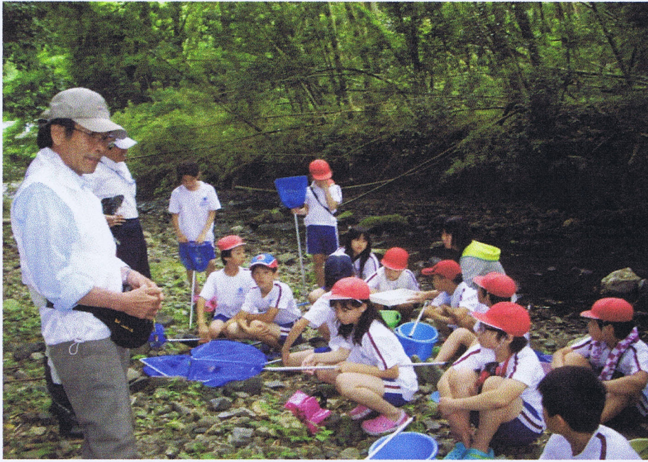
水生生物の捕獲の説明（矢倉川）