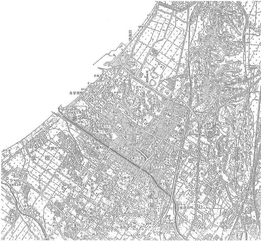
昭和 63 年（1988 年）地形測量図