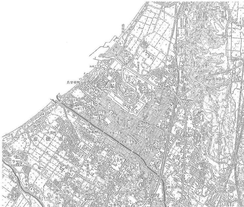
平成 15 年（2003 年）地形測量図