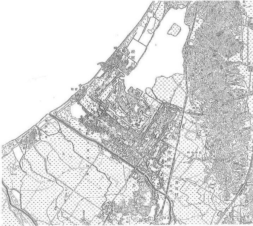
明治 28 年 (1895 年) 地形測量図