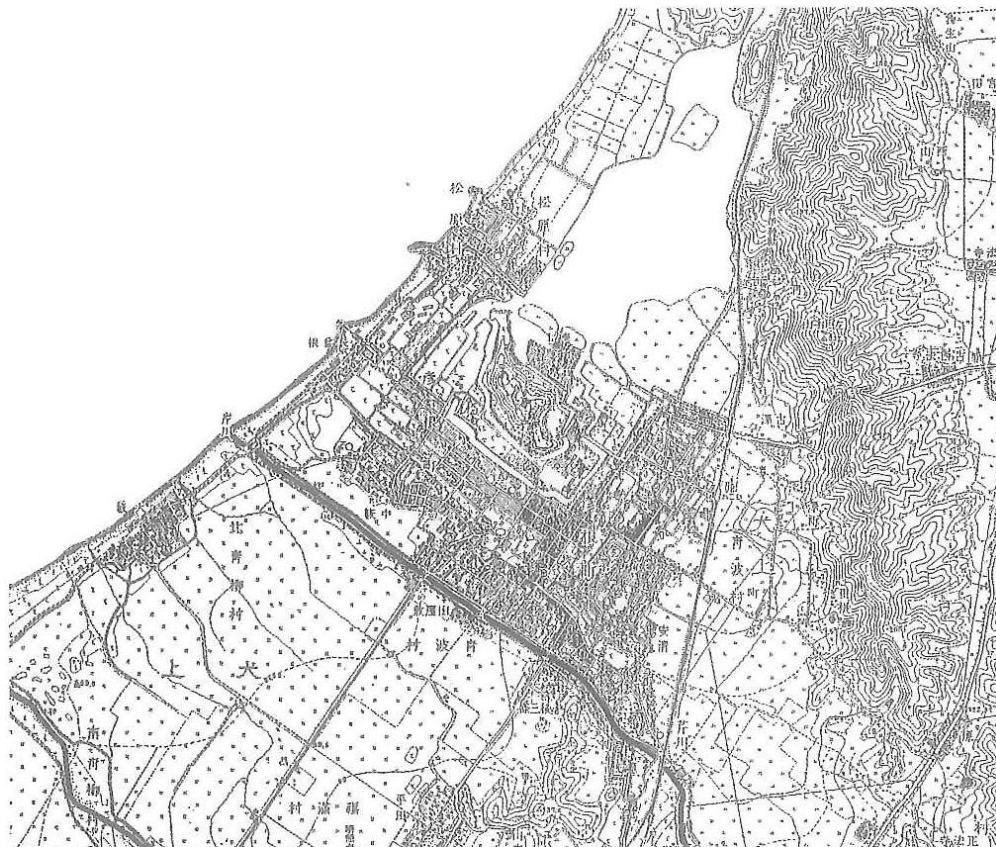
大正 13 年 (1924 年) 地形測量図