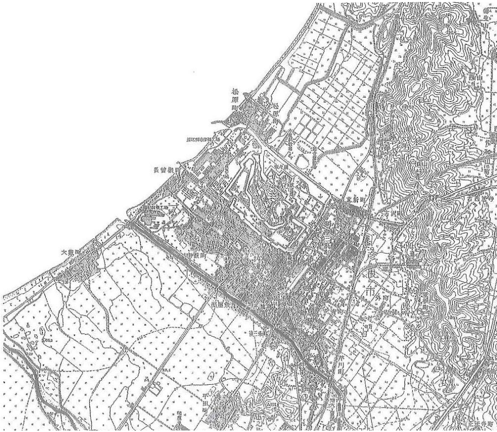
昭和 31 年 (1956 年) 地形測量図