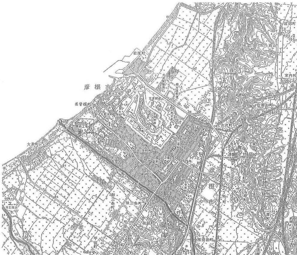
昭和 46 年 (1971 年) 地形測量図