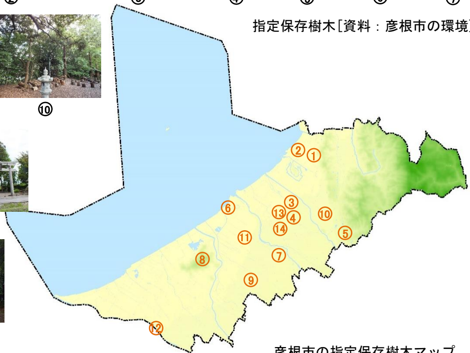
彦根市の指定保存樹木マップ