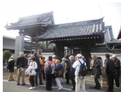
出前講座と文化財見学

講座・講演会などについては、本市学芸員が地域に出向いて文化財啓発を行う「出前講座」、外部講師によるシンポジウム、文化財の探索ウォークや見学会を実施し、文化財への関心を深める取り組みを行っており、今後も引き続き文化財に関する造詣を深めるための取り組みを推進する。