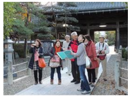
まち歩きイベント (まち遺産ネットひこね)