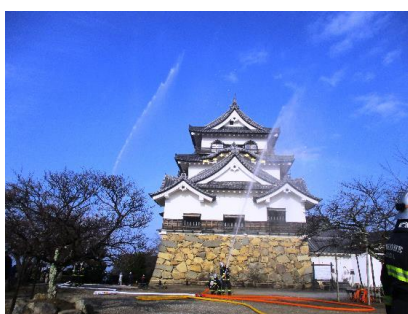
彦根城における防火活動訓練

文化財防火デーでは、彦根城を主会場として、消防署、地元消防団、自主防災組織が連携して消火訓練を実施し、万が一の火災発生時に迅速な行動がとれるよう取り組んでいる。また、文化財防火デーの前後には、1 年に 1 度、文化財課職員と消防署職員が共に文化財所有者宅を訪れて防災点検を実施し、不備な点の改善を指導するなどの取り組みを行っている。彦根城跡や一部の社寺などを除いては、防災訓練が実施できていないため、今後も文化財所有者、管理者の防災意識を高めるとともに、多くの市民に文化財保護思想の啓発の取り組みを続ける。