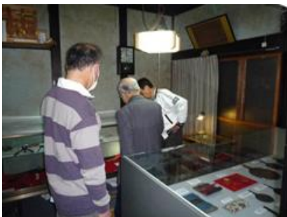
歴史的建造物での展示 (彦根まちかど資料館)