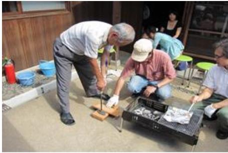
足軽屋敷銘板づくりワークショップ (NPO 法人彦根景観フォーラム)