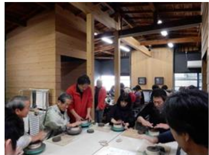
「湖東焼」体験教室 (湖東焼を育てる会)