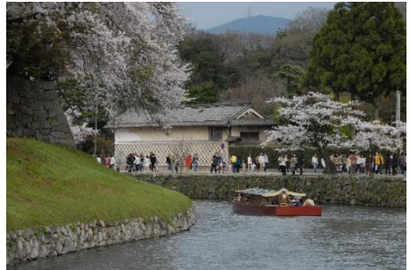
「御好屋形船」の運行 (NPO 法人小江戸彦根)