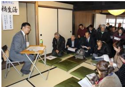
辻番所サロン「芹橋生活」 (彦根辻番所の会)