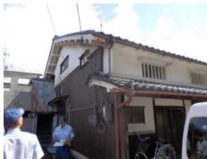
消防点検と文化財パトロール