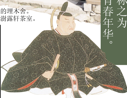
樱田门外事变2个月前画的「井伊直弼画像」。将自认为不错的和歌献给了清凉寺。

发行 彦根市教育委员会文化财课 〒522-0001 彦根市尾末町1-38 TEL 0749-26-5833 FAX 0749-26-5899 制作 / 榎永昌堂印刷