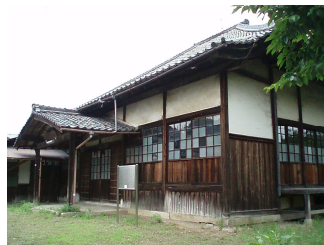
[ 歴史的風致形成建造物 ( 金亀会館保存修理 ) ]