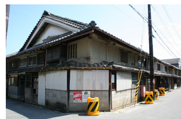
[ 歴史的風致形成建造物 ( 魚屋町長屋保存修理 ) ]