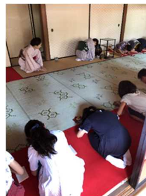
わくわく体験スクール「茶道を楽しもう」 R元.10