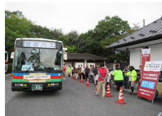
パーク・アンド・バスライド社会実験 R元.10