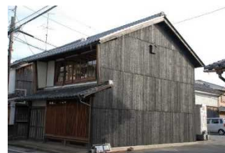
伝統的建造物の修理 H31.1