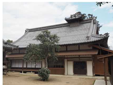
荒神山神社「社務所の保存修理」 社務所「外観」 R2.1