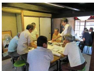
文化遺産を活かしたまちづくり研究会 R元.9

また、芹橋二丁目を中心に歴史的風致形成建造物を含む足軽組屋敷の特別公開が令和2年度を除き各年度で行われた。