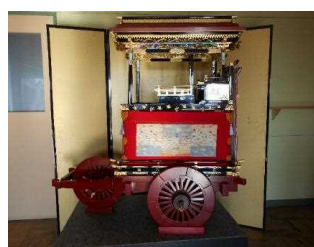
彦根仏壇の七職の技で製作された大津祭りの曳山のミニチュア R2.1