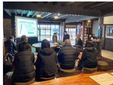
重伝建地区修景済み建物見学会 R3.11