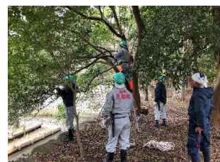
専門家による庭園管理指導 R3.6

小江戸ひこね町屋活用コンソーシアムに対して、空き町屋の利活用の推進を更に進めるため、小江戸ひこね町屋活用促進事業補助金による活動支援を行った。当該コンソーシアムの活動の結果、令和4年度までに15件の空き町屋が利活用に繋がった。