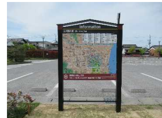
案内サインの設置 R4.5

善利組足軽組屋敷地区では、地元まちづくり関係者と行政職員が集まり、まちづくりに関する課題等について意見交換を行った。また、歴史的なまちなみにおける災害時の拠点場所となる整備に向けて、防災広場の公有化を完了した。