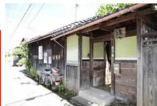
未指定文化財建造物の調査 R元.10