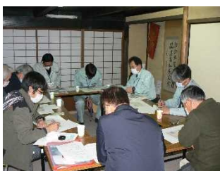
芹橋二丁目防災広場設置準備会との協議 R3.12