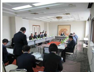
彦根市歴史的風致維持向上協議会 R2.2