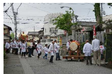
北野神社の天神祭り H30.5

5月に「天神祭」が2日間催され、その本殿祭では、神社の御鳳輦を先頭に御旅所を往復する渡御が行われる。渡御には、稚児行列や氏子11町の子どもに神輿が加わり、総勢500人を超える人数で、現在の城町から本町界隈を経由する。旧下魚屋町通りに面する旧広田家（納屋七）住宅やなどの歴史的建造物を通して、彦根固有の伝統文化を表現した。