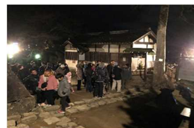
一般者が鐘を突く除夜の鐘の様子 R元.12

時報鐘は、築城当初、鐘の丸に設置され、城下に時を知らせていたと伝えられている。現在も「時報鐘」の鐘の音は、1日5回決まった時間に鐘の音を旧城下へ伝え、「時の鐘」として城下町彦根の歴史的風致を維持することができた。また、大晦日には、「彦根城で除夜の鐘をつくつどい」を開催し、多くの市民が時の鐘をついた。