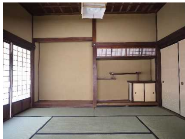
荒神山神社「社務所の保存修理」 社務所「巡查の間」 R2.1