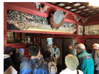
旧井伊神社社殿の特別公開 H31.4