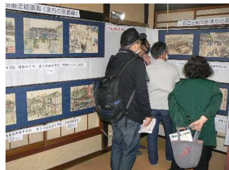
旧彦根藩足軽組屋敷の公開 (上田道三絵画展) R元.9

重要伝統的建造物群保存地区の「河原町芹町地区」では、地元の住民による保存会「河原町芹町美しい街づくり委員会」が住民内のネットワークの構築ならびに建造物の修理・修景事業に関する相談などの取り組みを行った。令和3年度に同地区で修理・修景事業を行った建造物の見学会が行われ、地元住民が重伝建地区のまちづくりに関して理解を深められたことにより、令和4年度に地元の方から修理等の相談が多数寄せられるようになった。