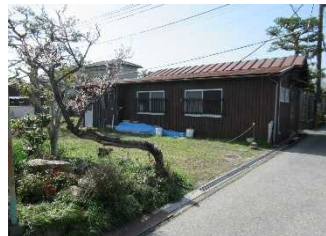
芹橋二丁目防災広場予定地 R3.3