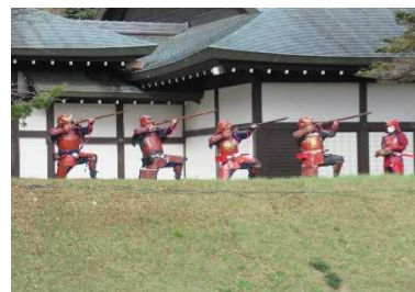
古式砲術の公開演武 R3.11