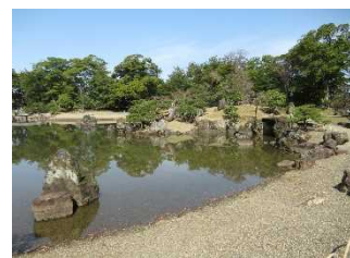
魚躍沼護岸の保存整備 R4.3

未指定文化財調査では、歴史的建造物の調査を行い、地域の歴史的特徴を残す建造物であることならびに、概ね当初の構造材が残っていることを確認し、往時の生活を知るうえで貴重な建造物を市指定文化財として指定を行い、適切な保護を図った。