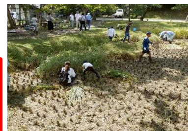
玄宮園での稲刈り体験会 R元.10