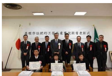
伝統的工芸品産業技術者表彰式 R2.1

彦根市地場産業活性化基本方針および行動計画に基づき、人件費補助を行い後継者の人材支援を進めるとともに、仏壇に関わる伝統的工芸品産業技術者の表彰を各年度に行った。（平成30年度から令和3年度までにかけて計11名）また、仏壇の需要が減少しているが、令和元年度には、彦根仏壇事業協同組合が3年かけて彦根仏壇の伝統技術を駆使して大津曳山のミニチュアを完成し、伝統技術の発表と活用につながった。