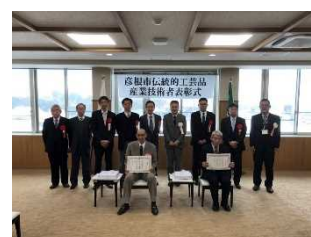
伝統的工芸品産業技術者表彰式 R4.1

仏壇に関わる伝統的工芸品産業技術者の表彰式を行った。また、県や他団体への展示会に出展し、彦根仏壇の魅力を発信するとともに、彦根市地場産業活性化基準方針および行動計画において、新たに雇用する職人に対しての人件費補助を行い後継者の支援を行った。