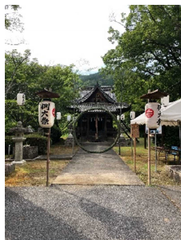
荒神山神社遥拝殿 「茅の輪くぐり設置」 R2.6

毎年4月に行われている稲村神社の春季例大祭「太鼓登山」は、少子高齢化により太鼓の担ぎ手となる若い衆が不足している。伝統行事を維持し守り伝えるために、地元町民全体の協力を呼びかけるなどの活動が行われた。近年は、新型コロナウイルスの感染症の拡大の影響で「太鼓登山」は中止されているが、春季例大祭の神事は静かに執り行われ信仰の山としての歴史的風致が維持された。