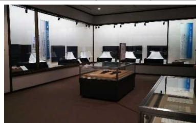
彦根城博物館における特別展 H30.10

また、名勝玄宮楽々園では、絵図に描かれている田園において、市民も参加する田植えおよび稲刈り体験を行った。