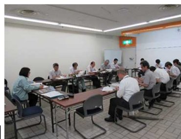
彦根市歴史まちづくり庁内推進会議 R元.7

歴史まちづくりの推進を図るため、令和2年度に文化財保護行政と都市計画および景観行政の組織をまとめ、歴史まちづくり部を新たに組織した。なお、庁内の関係部署が各種施策の調整を行うため、歴史まちづくり庁内推進会議を設置し、歴史まちづくり事業推進を図っている。