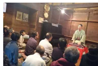
「宿駅 座・楽庵」にて寄席 H30.5

旧街道筋には、常夜灯のほか宿場に特徴的な施設や伝統産業に従事する歴史的建造物が数多く姿を留めている。その中で江戸期に麻布商であった商家（国登録 加藤家住宅）を所有者の支援を得ながら、滋賀県立大学の学生グループにより高宮地域のコミュニティの活性化を目指して、蔵を含む空間を『宿駅 座・楽庵』という喫茶兼ギャラリーとして活動・運営されており、寄席やピアノコンサートなどのイベントが歴史的建造物を活用した取り組みとして行われた。