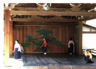
子ども狂言教室の発表会 H30.8

歴史的風致形成建造物である彦根城表御殿能舞台にて、伝統芸能の鑑賞や古典芸能の活動をされている団体、大学生のサークルおよび小学生が能または狂言の体験学習や発表を行った。令和2年度には、市と関係団体が連携して、彦根の夜を楽しむ「彦根夜の陣」を実施した。また、能舞台を夜間にライトアップし特別公開を行った。