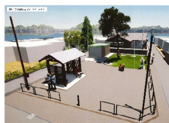
芹橋二丁目防災広場イメージパース