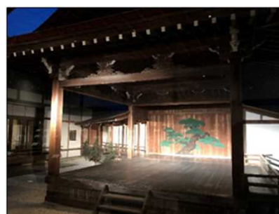
彦根城表御殿能舞台 ライトアップ R2.9