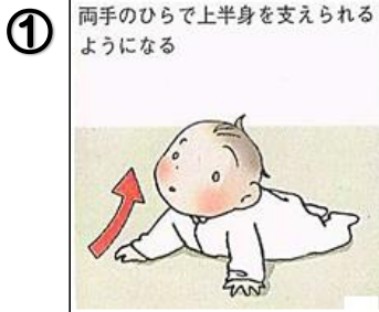
イラスト: 赤ちゃんのからだBOOK (株)海竜社より引用