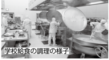
学校給食の調理の様子

います。調理過程で異物混入を防ぐために、機器の取り扱いを徹底しているほか、調理員の服装は頭部全体が収まり、ボタン類のない最新の調理服を着用し、調理しています。