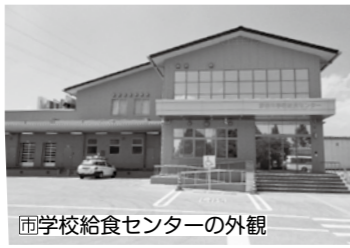
圏学校給食センターの外観

圏学校給食センターは、湖東定住自立圏を形成している1市4町のうち彦根市・豊郷町・甲良町の学校給食を提供しています。