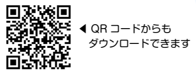
QRコードからもダウンロードできます