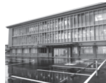
▲休日急病診療所はくすのきセンター(市立病院敷地内)の1階です

も対応できるように産婦人科診療体制の維持・充実に努めています。また、小児科その他の関係診療科と連携を深め、母子ともに安心・安全な周産期医療体制の構築に取り組んでいます。