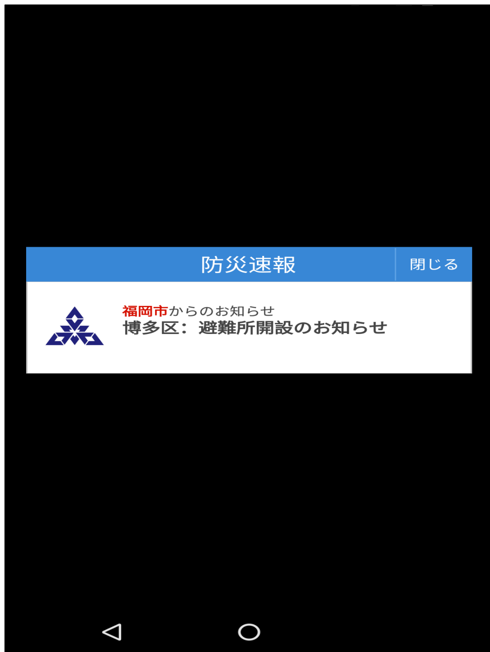
□ ポップアップ通知画面（サンプル）