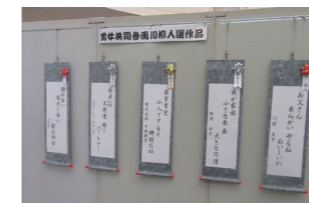
▲入選作品展示(昨年度)