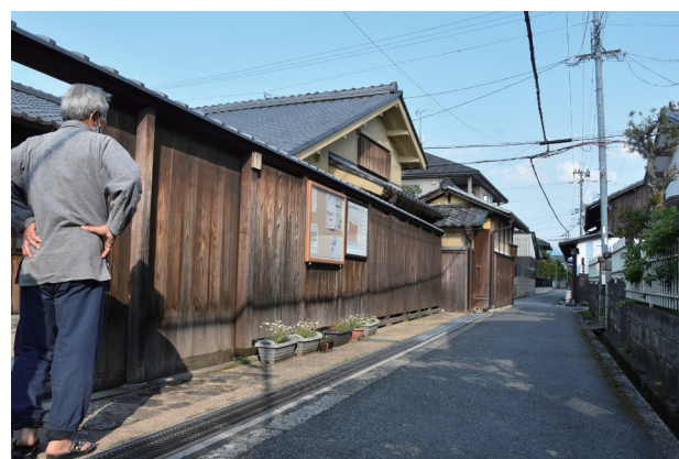
▲辻番所の外の様子

歴史的に価値があり、まさに芹橋地区のシンボルとも言えるこの住宅が失われてしまうことに、私を含む地元の人々が危機感を感じ、買取のための募金活動を進める傍ら、買い取った後の文化財としての保存と利活用を進めることを目的に、彦根辻番所の会を設立しました。