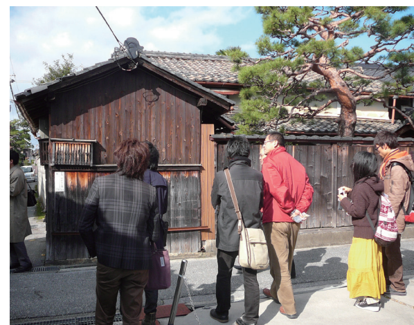
▲辻番所の周辺を散策する人々

ここでの学びや語りから、辻番所の会の活動が、自治会と共同した地域のまちづくりや防災活動にまで発展しました。