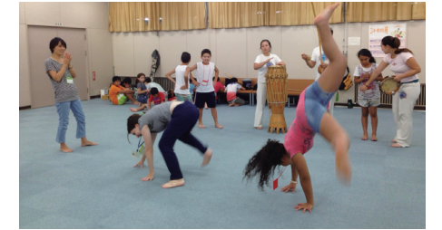
▲ブラジルの格闘技カポエイラの体験

今年度からは、市内国際交流団体や多文化共生サポーターと協力しながら、実施しています。