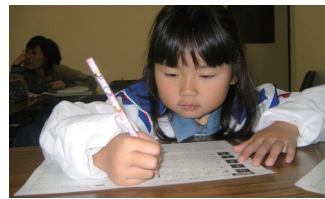
▲母語教室に通っていた当時の様子

今はポルトガル語の支援員として、市内の小中学校で、外国にルーツをもつ子どもたちの学習支援や保護者への通訳支援をしています。