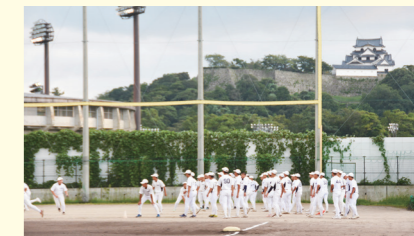
▲今回の取材では、新チームのとても良い雰囲気伝わってきました!がんばれば、近江高校!