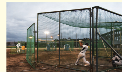
▲3年生が引退し、2年生を中心に、厳しい練習を真剣かつ丁寧にやっている様子でした。