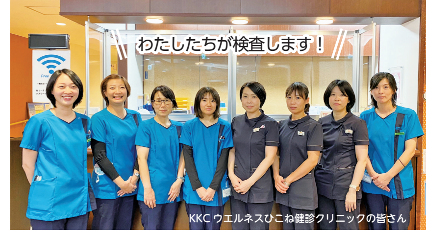
KKC ウェルネスひこね健診クリニックの皆さん

今回は、KKC ウェルネスひこね健診クリニックのがん検診を紹介します。※新型コロナウイルス感染症流行後、感染予防を徹底して実施しています。