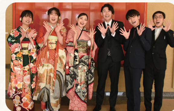
▲令和6年実行委員の皆さん

司会進行や代表あいさつ、企画運営などを行います。 👤 今年度、20歳になる人で、活動意欲があり、数回程度の実行委員会および前日リハーサルなどに参加できる人 📅 15人程度 (選考) 📅 5月1日(水)~同31日(金)に Web フォーム (QRコード) 📞 実行委員に決定した人には6月末までに連絡します。 【HP番号: 13935】