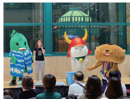
▲昨年のイベントの様子