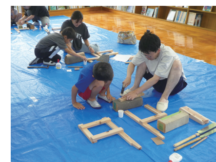
▲子ども教室で、椅子を作る参加者

県立彦根工業高校の皆さんと一緒に、木製ミニチュア椅子作りを体験しよう。 ㊦ 7月12日(土) 10:00～11:30 対 小学生（保護者同伴）・中学生 定 15人（抽選） 料 500円 申 6月27日(金)～7月5日(土)