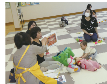
▲子育て講座でお口のケアを学ぶ参加者

彦根児童合唱団による歌声をお楽しみください。 ㊦ 6月8日(日) 13:30～、15:00～（2回公演）