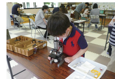
▲子ども教室で、顕微鏡を使う参加者

本格的な顕微鏡やルーペを使って、不思議なミクロの世界を探検しよう。 ㊦ 6月21日(土) 10:00～11:30 対 小学生（保護者同伴）・中学生 定 15人（先着順） 料 200円 申 6月6日(金)～同14日(土)