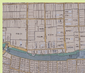
▲御城下惣絵図(部分)

彦根城の防御を担った石垣や堀、櫓などのあり方や、城下町の街区や施設の配置など、城と城下町の空間構造を、絵図や古文書から読み解きます。