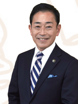
彦根市長 田島 一成

市政の目指す方向と市民の皆様の思いを擦り合わせながら、施策の充実に取り組み、また新たなニーズにも迅速に対応できるよう、市民サービスの向上に努めてまいりたいと考えております。そのためにも、優先度・緊急度に基づいた事業の見直しや、公共施設のあり方について検討するとともに、自主財源を確保する体制づくりを推し進め、持続可能な財政運営に向けて取り組んでまいります。