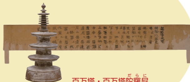
百万塔・百万塔陀羅尼

投票期間 6月15日(月)まで 結果発表 7月1日(水) ※ランキング上位の作品は、7月24日(金)~9月14日(月)に展示します。