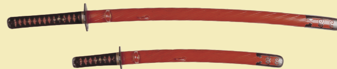
朱漆塗蛭巻鞘大小拵

13代直弼の愛娘弥千代の婚礼のために調えられた、大揃いの雑道具。その華麗さに釘付け！