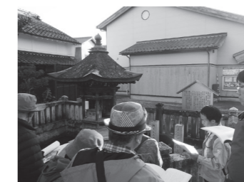
▲歴史探索ウォークの様子