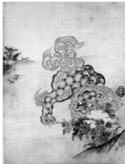
龍潭寺方丈襖絵のうち、牡丹唐獅子図