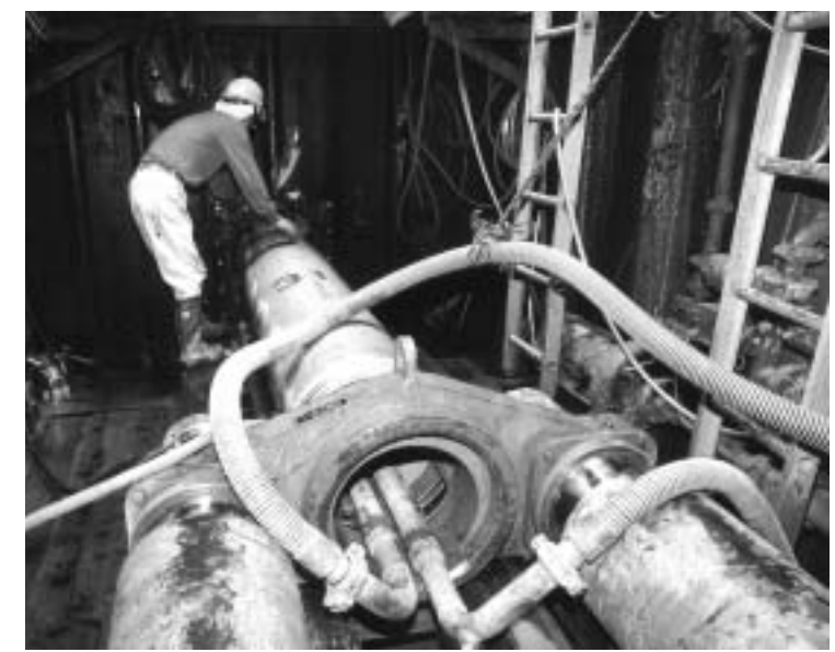
地下6.5mで作業をする下水道工事の現場（肥田町）