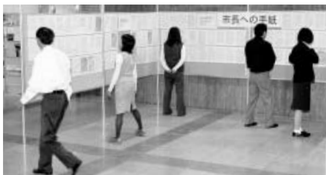
昨年の揭示の様子

期間 12月9日(月)～同20日(金) 場所 市役所1階ロビー 問い合わせ先 市民広聴室 ② 1411番内線101番 FAX 21398番