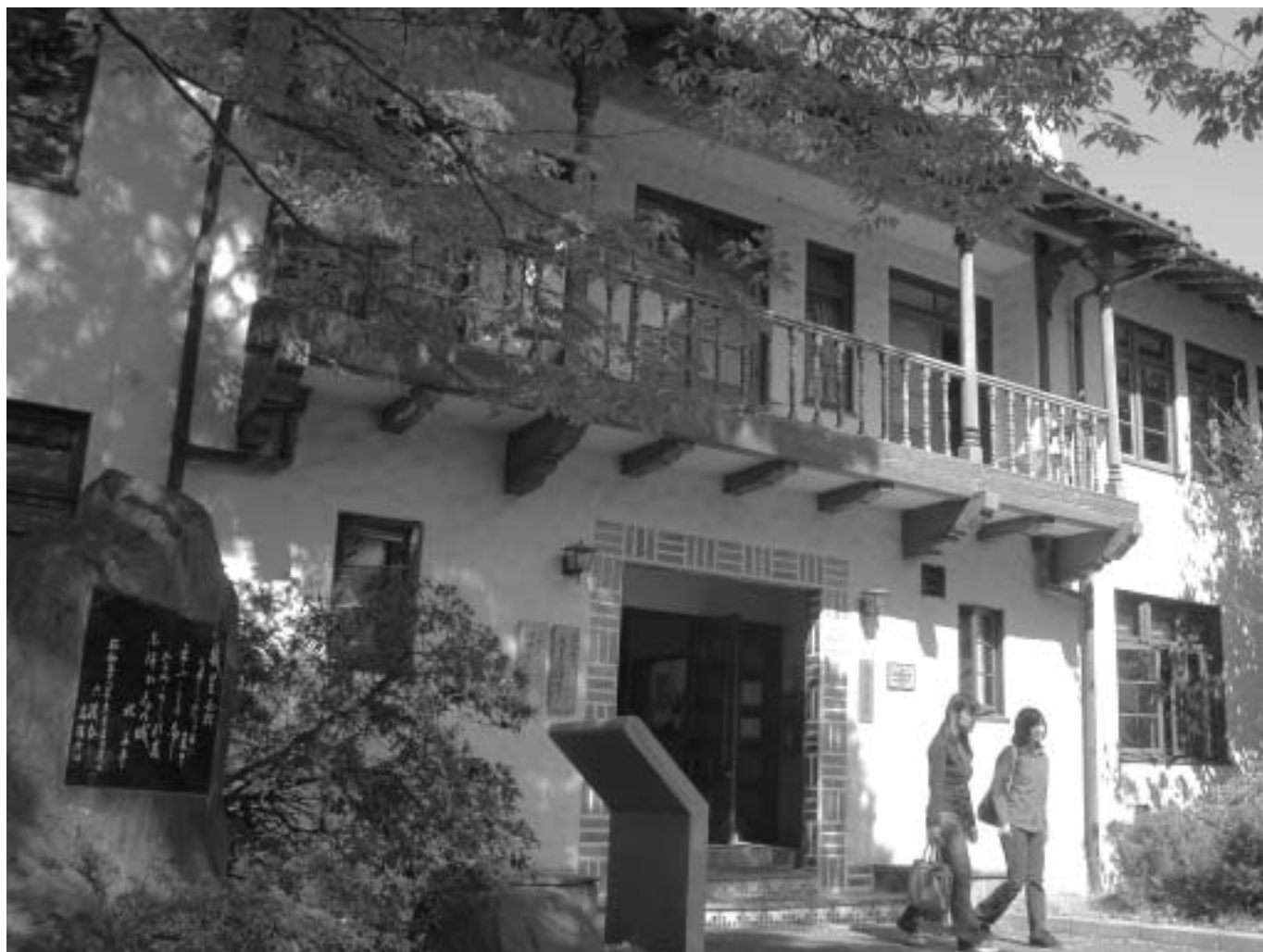
滋賀大学経済学部構内の りょうすい 陵水会館